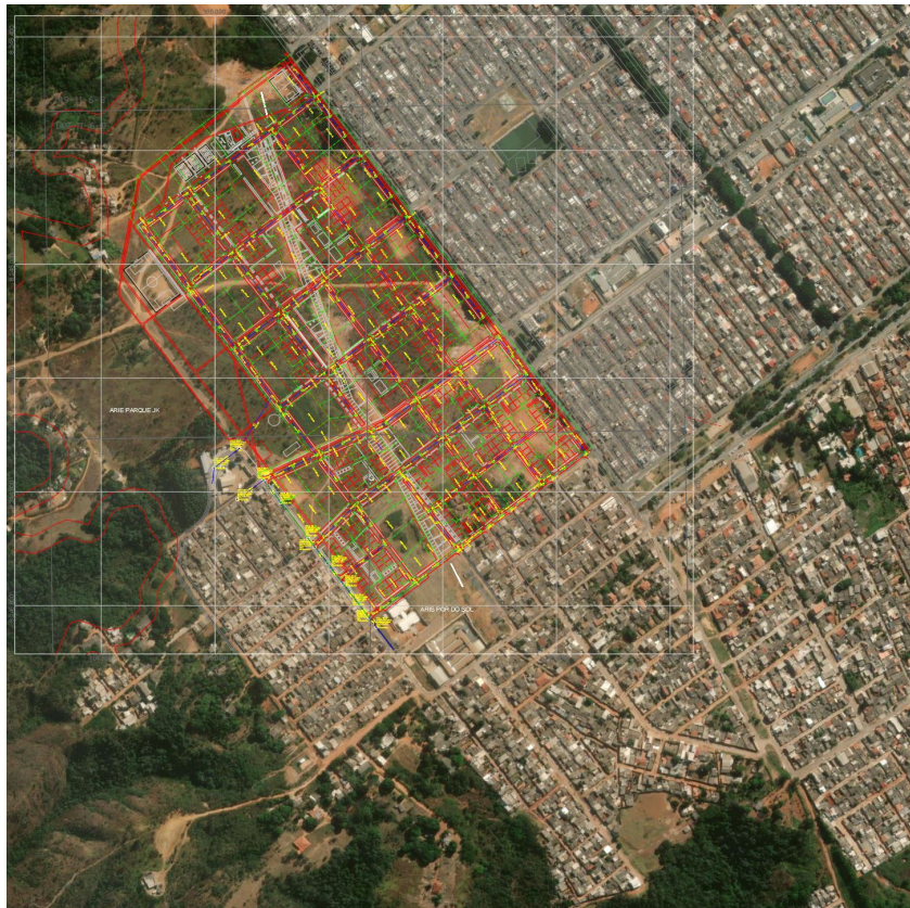
Figura 05 - Área com previsão de ampliação urbana a ser incorporada nos cálculos de contribuição de drenagem