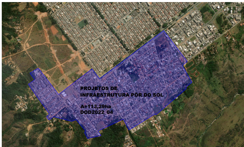
Figura 2 - Mapa Geral da Poligonal do Empreendimento

9.4. A poligonal de estudo situa-se em área de contribuição do Ribeirão Taguatinga, na Região Administrativa do Pôr do Sol, conforme mostrado na figura a seguir: