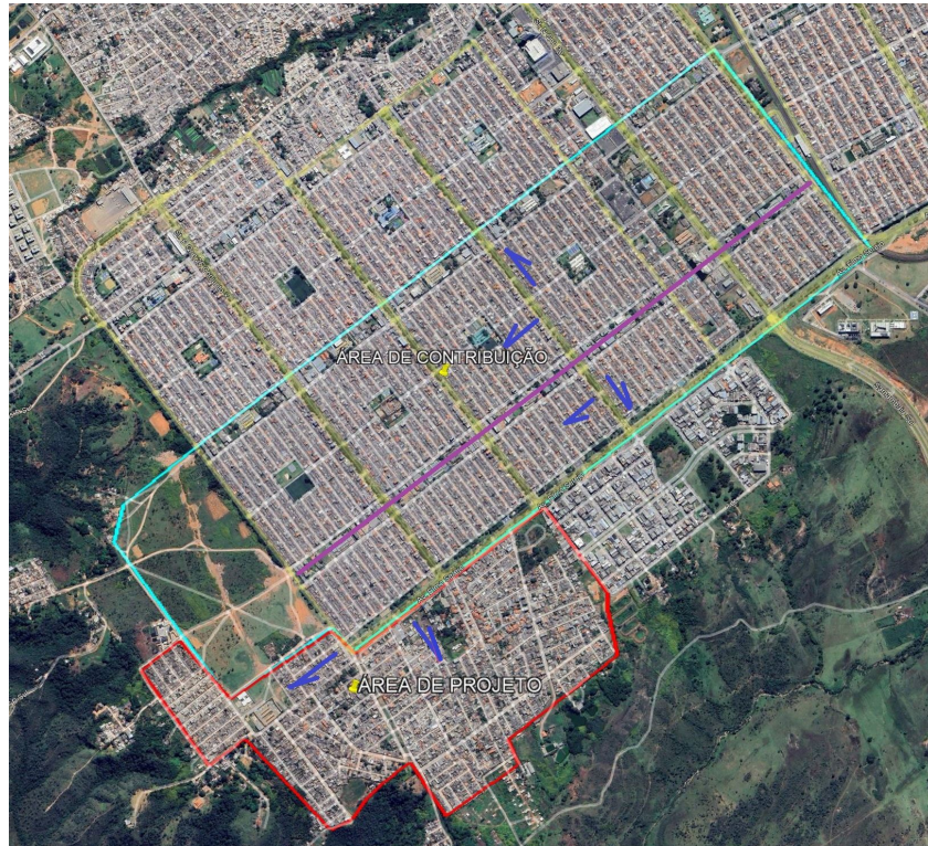
Figura 04 - Áreas das Bacias de Contribuição para dimensionamento da rede de drenagem (vermelho - Área efetiva do Projeto / Azul Claro - Área existente a ser considerada como Contribuição)

b) Após estudo da área, mediante a comprovação da necessidade de implantação do sistema proposto, o sistema de drenagem será implantada preferencialmente dentro da poligonal indicada, salvo em situações específicas e necessárias, porém a área de contribuição a ser considerada deverá ser toda área adjacente que contribui para tal, mesmo que seja externa à delimitação. A CONTRATADA deverá delimitar as áreas de contribuição e o sistema a ser implantado deverá ter capacidade suficiente para absorver todo escoamento superficial.