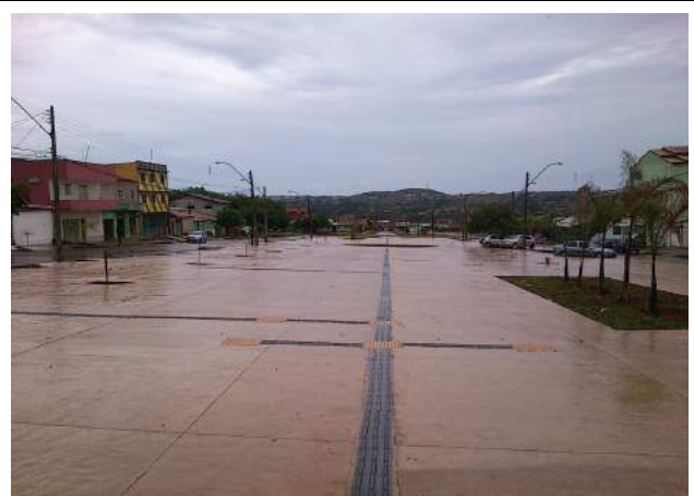
Construção de praça e execução de paisagismo nos Conjuntos 10 a 15 da quadra 103, no Bairro Residencial Oeste, São Sebastião – DF.