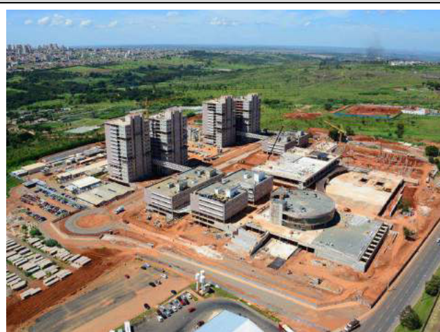
Desenvolvimento das obras do Centro Administrativo do Distrito Federal - CADF

Este empreendimento tem enfoque destacado no Capítulo 6, item 6.2 deste Relatório.