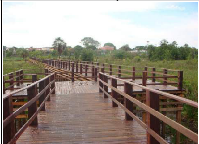
Construção de passarela para pedestres, em madeira, interligando Sobradinho I e II, no Parque Vivencial, Sobradinho – DF, CT 021/2012-SO - Obras concluída