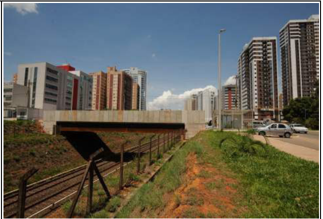
Construção de viaduto na Rua Ipê Amarelo em Aguas Claras/DF CT 027/2013-SO – obras em andamento