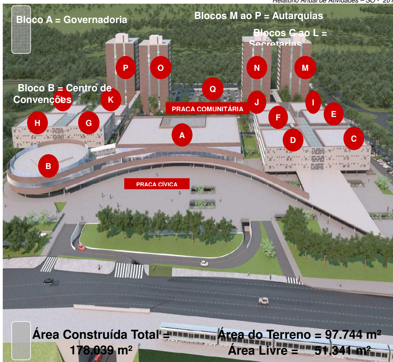
Figura 1 - Layout do empreendimento