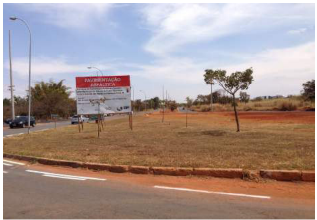
Execução de pavimentação asfáltica, passeios e meios-fios para duplicação da Estrada de Clubes Esportivos, entre a Avenida das Nações e o acesso à Ponte JK, no Plano Piloto-DF.