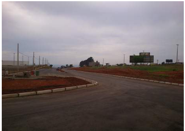
Execução de pavimentação asfáltica e drenagem pluvial no Polo JK, Etapa 01, na Região Administrativa de Santa Maria.