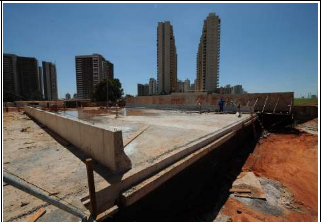
Construção de viaduto em Águas Claras/DF, CT 025/2013-SO (Av. Araçá), CT 026/2013-SO (Av. Araucárias) - Obras em andamento