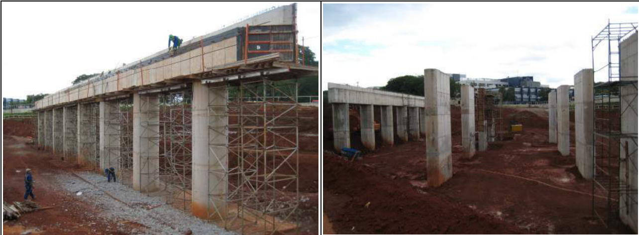
Retomada das obras de construção do viaduto de interseção da Estrada Setor Policial - ESPM com a via W3-Sul - Brasília/DF, CT 034/2013, em andamento.