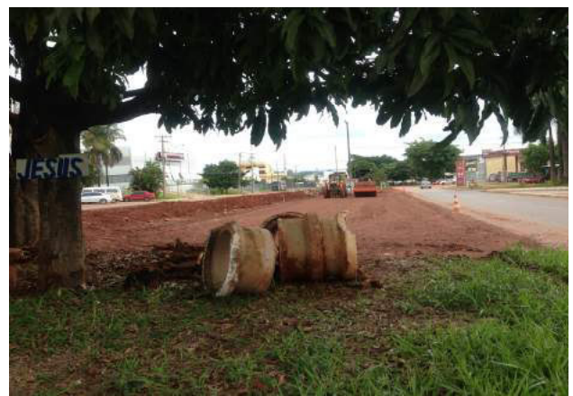
Execução de pavimentação asfáltica (estacionamento) e drenagem pluvial na Quadra 03 do Setor de Armazenagem e Abastecimento Norte - SAAN, no Plano Piloto – DF.