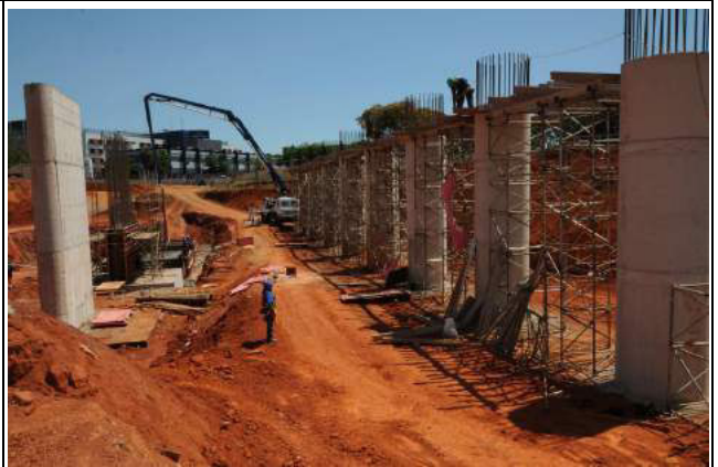
Retomada das obras de construção do viaduto de interseção da Estrada Setor Policial - ESPM com a via W3-Sul - Brasília/DF, CT 034/2013, em andamento.