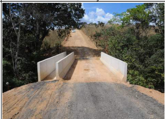
Construção de ponte sobre o Ribeirão Engenho das Lages, no Gama /DF, CT 005/2013-SO - Obras concluída

Além dos investimentos relatados, foram também efetivados os contratos seguintes, que complementaram a atuação desta Pasta em 2013, e cujas obras serão executadas em 2014: