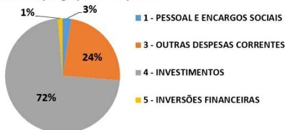
Gráfico representativo dos créditos orçamentários iniciais, oriundos da LOA 2023, por grupos de despesas.

Considerando o quadro acima e respectiva representação gráfica, 72% dos recursos consignados no Quadro de Detalhamento das Despesas - QDD desta SO DF, foram alocados no Grupo 4 - Investimentos, correspondendo a R$ 663.771.312,00, e 23,75% do Orçamento da Pasta se destinavam ao Grupo 3 - Outras Despesas Correntes, equivalentes a R$ 217.448.886,00.