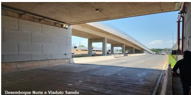
Desemboque Norte e Viaduto Samdu